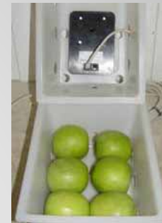
Capteur d'AC Dynamique